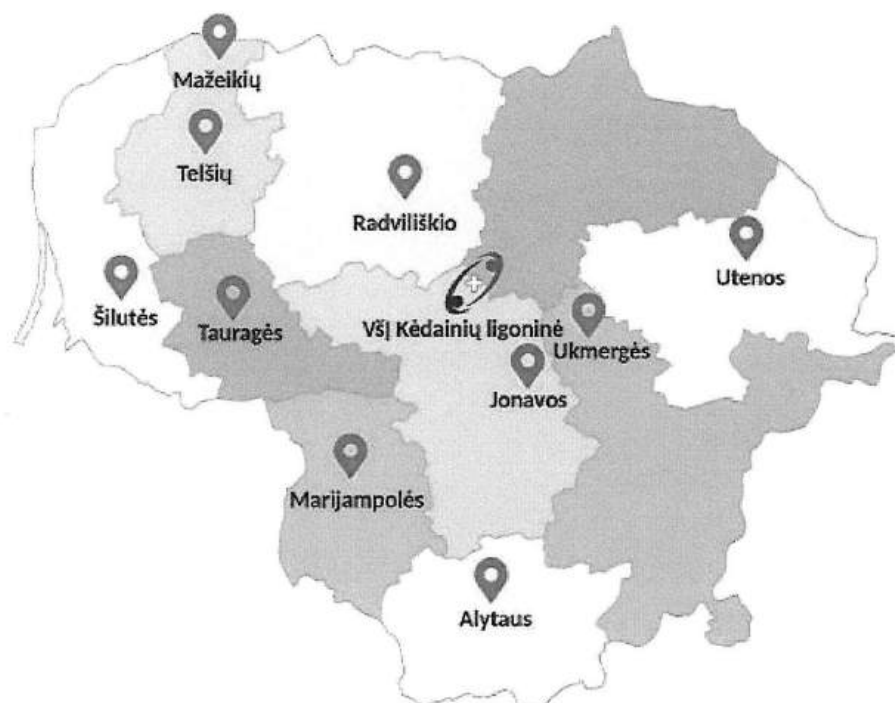
1 pav. Regioninės ligoninės